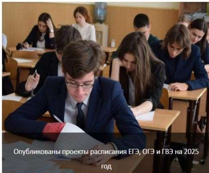
Опубликованы проекты расписания ЕГЭ, ОГЭ и ГВЭ на 2025 год